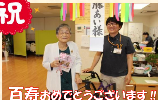
百寿おめでとうございます!!