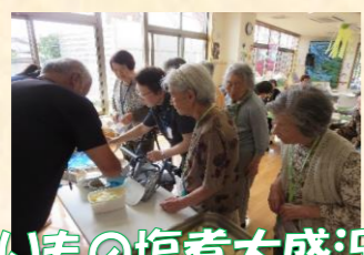
いもの塩煮大盛況